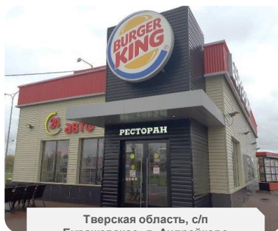
Тверская область, с/п Бурашевское, д. Андрейково в фонде с 22.10.2021