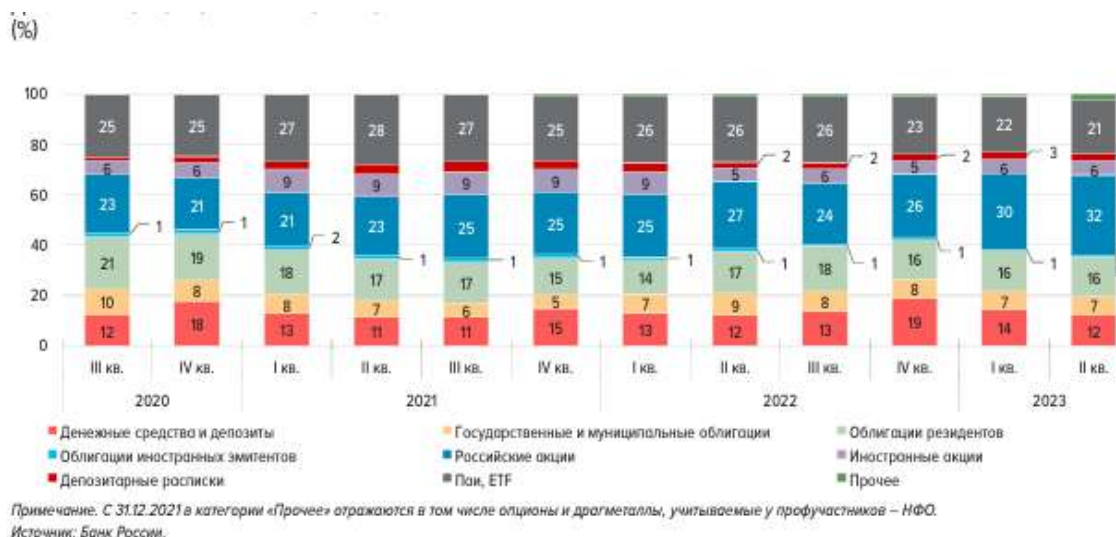
Рисунок 1 Динамика структуры активов ИИС 1

В структуре активов ИИС (в рамках брокерского обслуживания и доверительного управления) в II квартале 2023 г. продолжались снижение доли денежных средств и рост доли акций. В результате положительной переоценки и инвестирования денежных средств доля акций резидентов выросла с 30 до 32%, максимального значения за все время наблюдений. Несмотря на ослабление рубля и положительную валютную переоценку, доля иностранных активов на ИИС (включая иностранную валюту на счетах) снизилась за квартал с 16 до 14%. При этом доля валют недружественных стран (доллары США и евро) на счетах оставалась ниже 2%. Доля прочих иностранных валют (прежде всего юаней) не превышала 1%. Вложения в иностранные активы сократились в рамках обоих типов счетов: доля иностранных активов на брокерских ИИС снизилась с 18 до 15%, а на ИИС в рамках ДУ – с 6 до 1%.